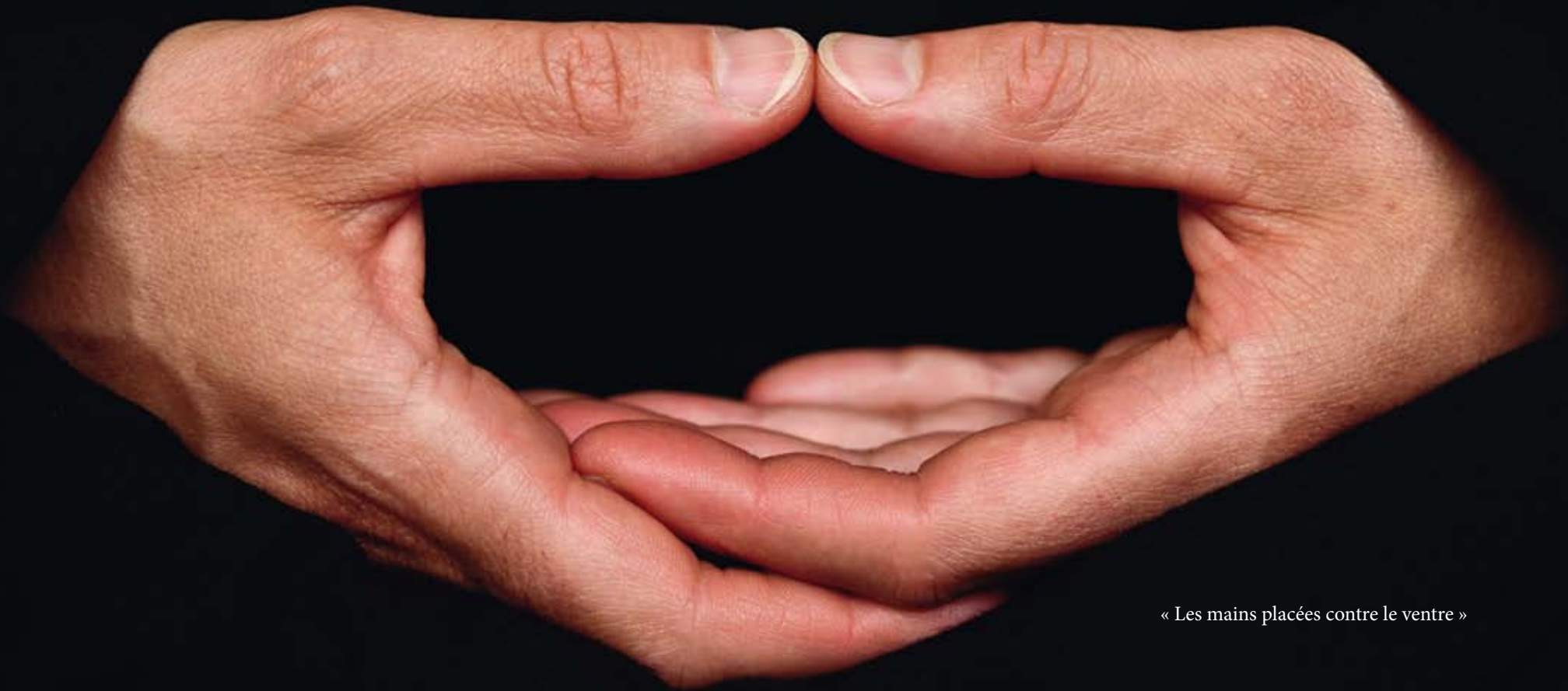
« Les mains placées contre le ventre »

« Le zazen dont je parle n'est pas un apprentissage de la méditation, il n'est rien d'autre que le dharma de paix et de bonheur, la pratique-réalisation d'un éveil parfait(...) Une fois que vous avez saisi son cœur, vous êtes semblable au dragon pénétrant dans l'eau ou au tigre rentrant dans la forêt », maître Dôgen, XIII e siècle.